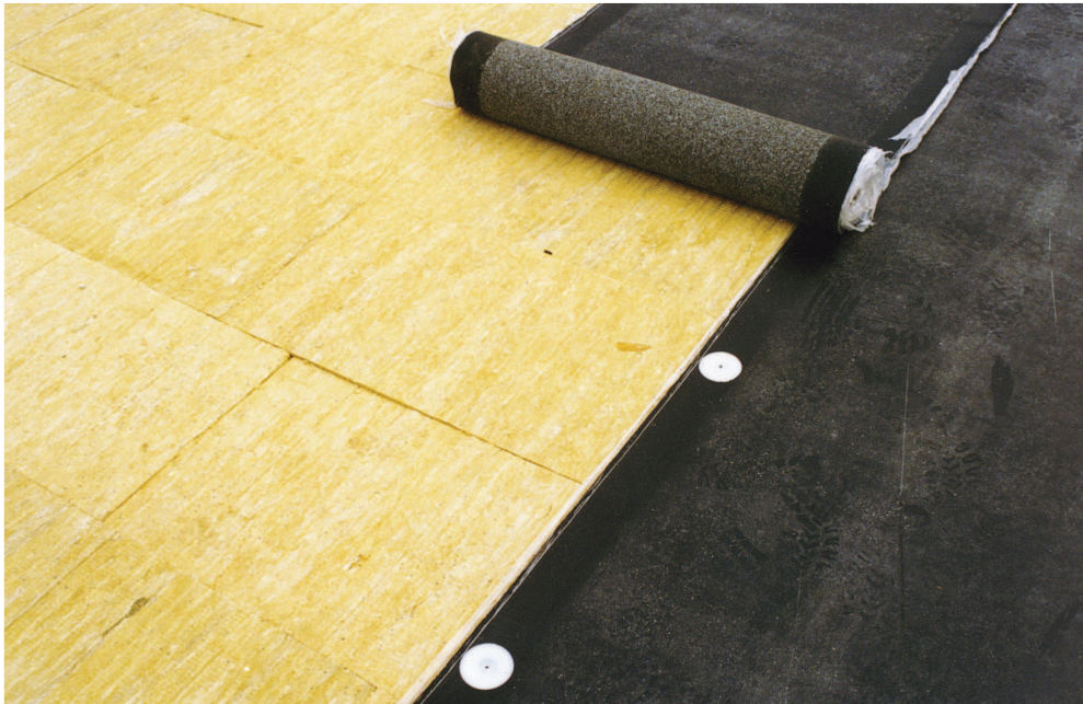
Deska z minerální vlny Spádová deska z minerální vlny