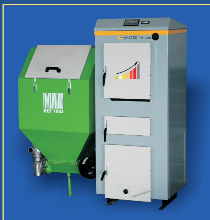
Schéma kotlů MASTER-M UNI