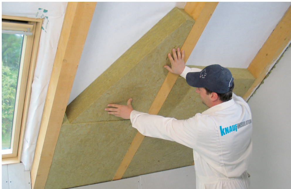
Deska z minerální vlny