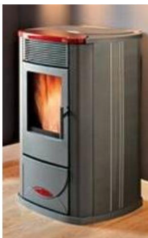
Idrotech šedý plus keramika bordo