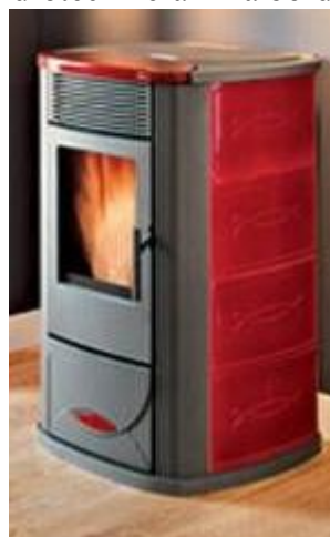
Idrotech keramika bordo